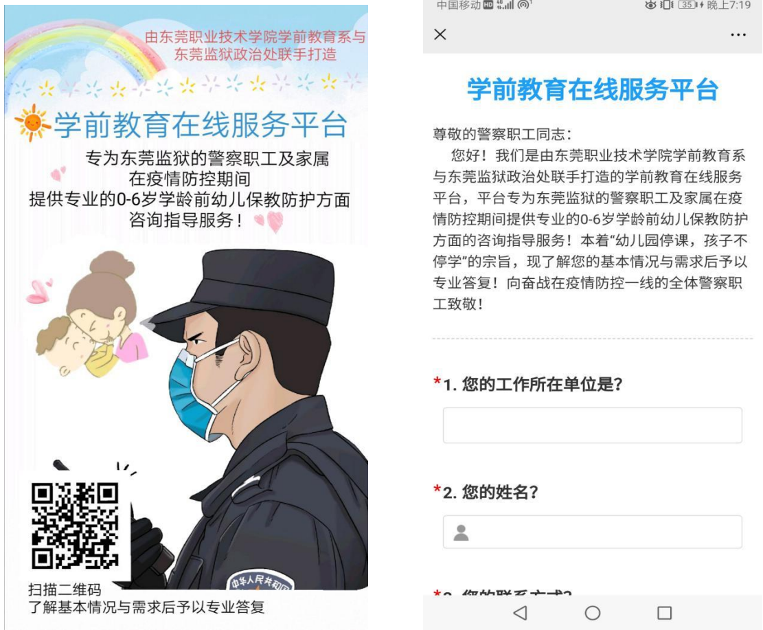
图 1 与广东省东莞监狱联手搭建学前教育在线服务平台

资源，引导学生自主学习。 课程融合社会实践项目开展 ，教师指导学生将课程以社会实践志愿服务项目的形式申报到校团委，学生参与的积极性得到激发。同时，寻求社会资源，与广东省东莞监狱政治处合作搭建学前教育在线服务平台，为东莞监狱有需要的家庭提供服务。